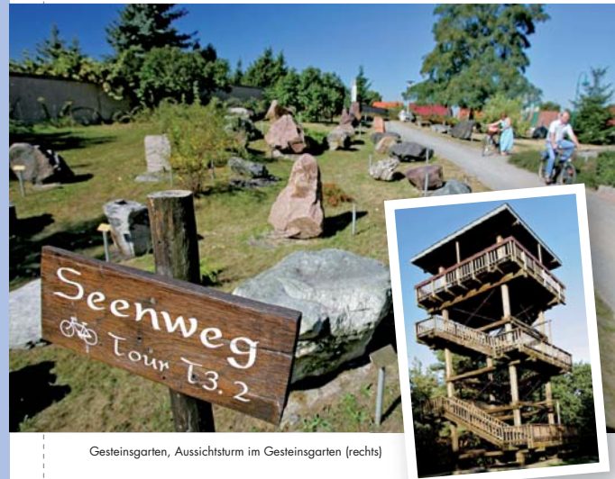
Gesteinsgarten, Aussichtsturm im Gesteinsgarten (rechts)

20 glasklare Seen und viel Wald umgeben Gommern. Im Zentrum steht die 1.000-jährige Wasserburg, in deren Nähe sich die Gesteins-, Kräuter- und Heidegärten befinden. Für Ausflüge mit dem Fahrrad, mit dem Wanderstock und der Picknickdecke ist Gommern ideal – und die Badesachen sollten auch im Gepäck sein.