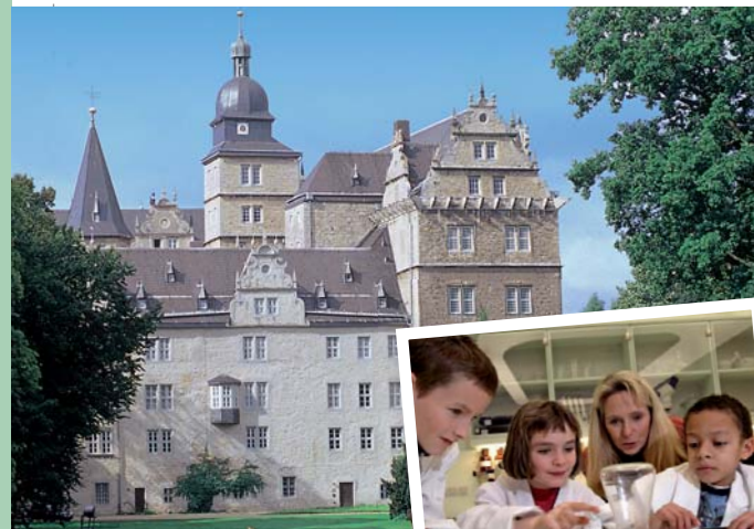
Schloss, Schüler auf „Entdeckertour“ (rechts)

Im Jahre 1938 auf einer grünen Wiese gegründet, hat sich die Autostadt Wolfsburg von einer Arbeitersiedlung zu einer modernen Großstadt entwickelt, die viele Attraktionen für einen Ausflug bereithält.