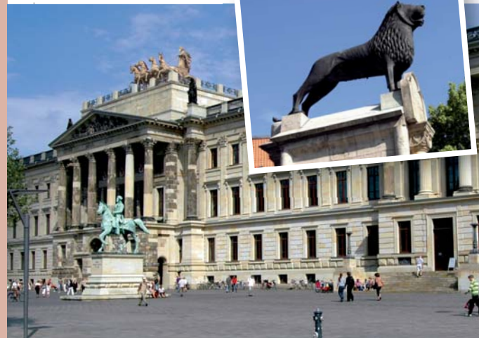
Residenzschloss, Burglöwe (rechts)

Heinrich der Löwe machte Braunschweig im 12. Jahrhundert zu seiner Residenz. Die mittelalterliche Struktur ist noch zu erkennen. Sehenswert: Burgplatz mit Burg Dankwarderode, Dom und Burglöwen.