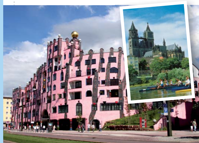
Hundertwasserhaus „Grüne Zitadelle von Magdeburg“, Dom (rechts)

Die Landeshauptstadt gilt als eine der grünen deutschen Städte. Lohnend sind Abstecher in die Parks oder ans Elbufer. Beim Stadtrundgang fallen besonders der Dom, das Kloster Unser Lieben Frauen und natürlich das bunte Hundertwasserhaus auf.