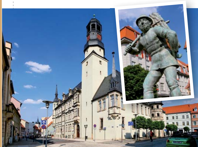
Rathaus, Holzträger-Figur auf dem Holzmarkt (rechts)

Kriminalpanoptikum Aschersleben Telefon: 03473/2265942 www.kriminalpanoptikum.de